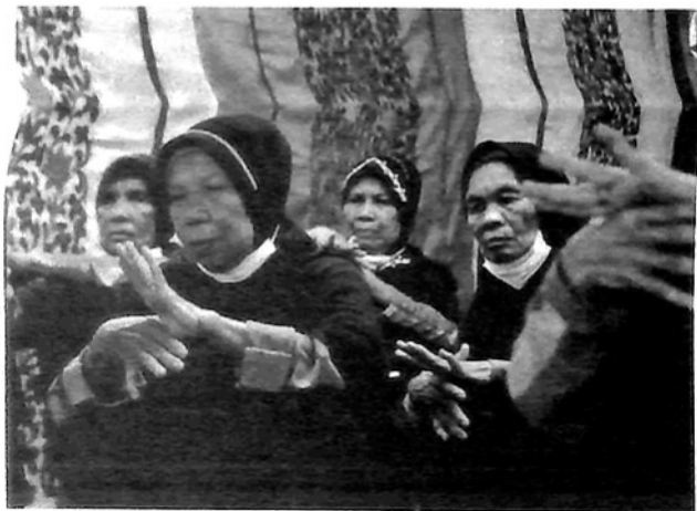
LANSIA – Para Lansia Kota Padang Panjang memeriahkan puncak Hari Lansia.

Padang Panjang, Khazanah —Puncak Hari Lansia, Hari Hipertensi se-Dunia, Hari Asma dan Hari Tanpa Tembakau digelar di Puskesmas Gunung, Senin (30/5).