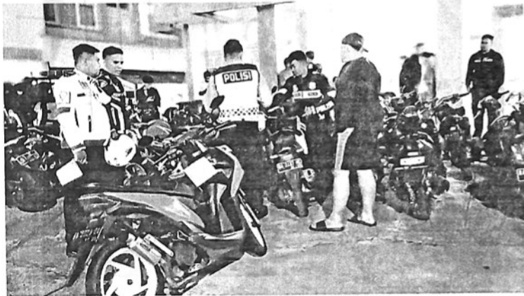
KENDARAAN berknalpot racing berhasil diamankan Satlantas Polres Padangpanjang dalam Patroli blue light yang berlangsung, Sabtu (28/5) sampai dengan Minggu dini hari.

PADANGPANJANG, KP - Sebanyak 20 kendaraan berknalpot racing berhasil diamankan Satlantas Polres Padangpanjang dalam kegiatan yang berlangsung, Sabtu (28/5) sampai dengan Minggu dini hari. Patroli blue light dilakukan di pusat keramaian Kota Padangpanjang.