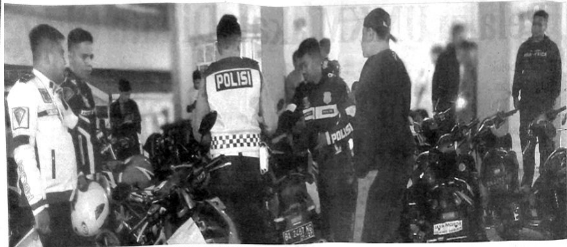
PETUGAS Satlantas Polres Padangpanjang ketika mengamankan kendaraan yang menggunakan knalpot racing.

Dia mengaku, untuk ketersediaan pakan ternaknya sudah ada yang menyuplai dan tak pernah kesulitan dalam mendapatkannya. Bahkan dikombinasikan dengan produk sisa rumah tangga yang berkualitas. Kesuksesannya di bidang ternak ayam kampung ini menjadi penyemangat rekan-rekan sejawatnya. Bahkan kini banyak sekali tentara yang sudah purna tugas belajar bisnis ayam kampung dengannya. (suk)