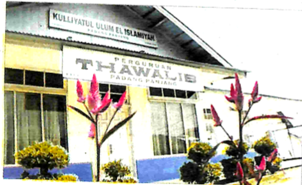
PENDIDIKAN: Perguruan Thawalib Padangpanjang memiliki aset Rp 50.604.276.000.