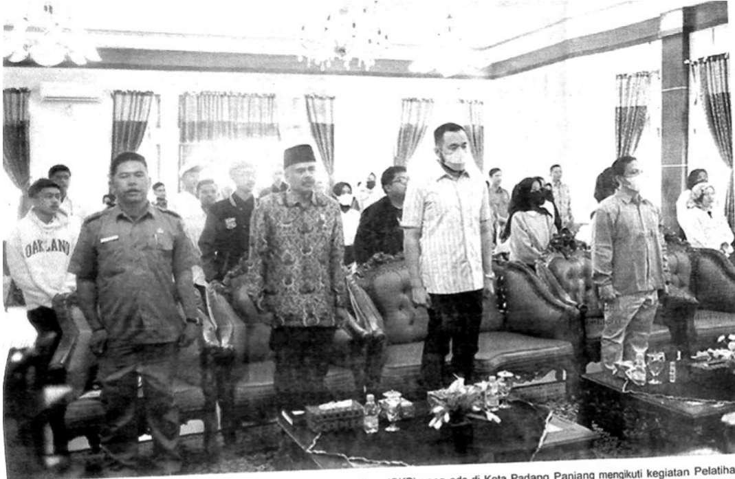
GENERASI MUDA — Sebanyak 35 peserta dari Organisasi Kepemudaan (OKP) yang ada di Kota Padang Panjang mengikuti kegiatan Pelatihan Kepemimpinan Bagi Generasi Muda Kota Padang Panjang tahun 2022 (Young Summit and Leadership Training) Angkatan ke II. APIZRAJUALAM