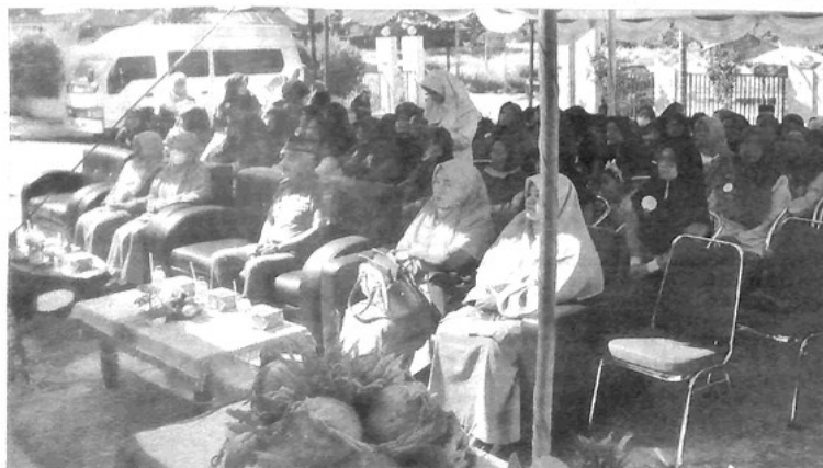
KEGIATAN peringatan Hari Lansia yang dilaksanakan di Puskesmas Gunung Kecamatan Padangpanjang Timur.

Aldy mengimbau kepada masyarakat agar tidak menggunakan knalpot racing, ia juga mengimbau kepada para orang tua agar tidak mengizinkan anak-anak mereka menggunakan knalpot racing pada kendaraannya. (ned)